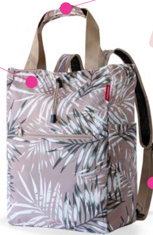
jungle sand mini maxi 2-in-1 plus