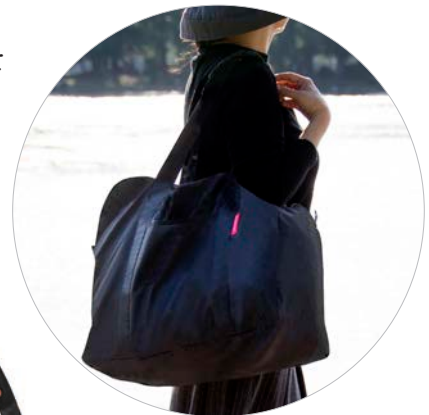
mini maxi touringbag