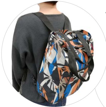
miami black mini maxi 2-in-1 with iso pocket