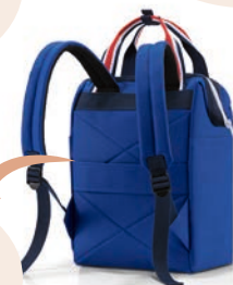
special edition nautic