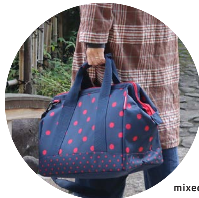
mixed dots red