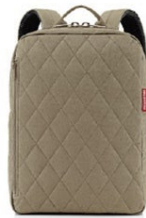
CLASSIC BACKPACK M