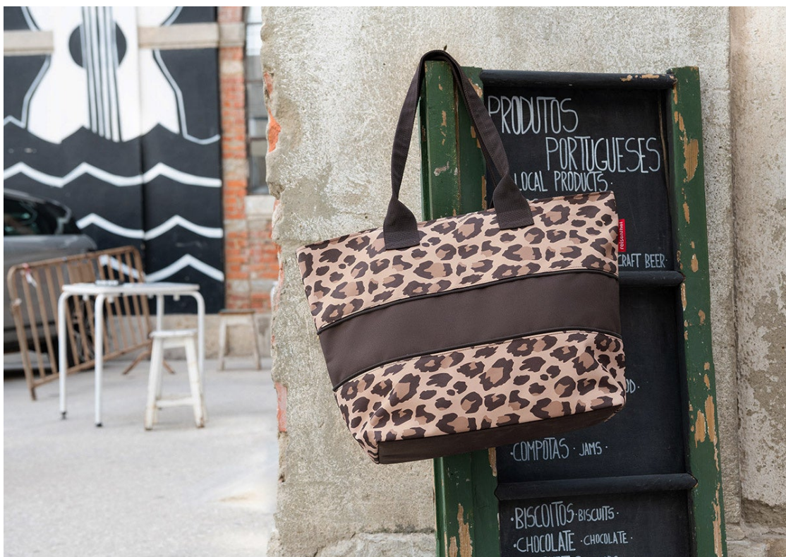
LEO MACCHIATO (レオ マキアート)