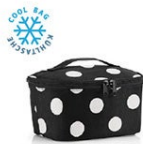
COOLERBAG S POCKET