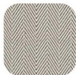
ヘリンボン サンド