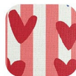
ハート & ストライプ