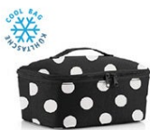
COOLERBAG M POCKET