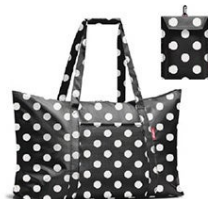
MINI MAXI TRAVELBAG