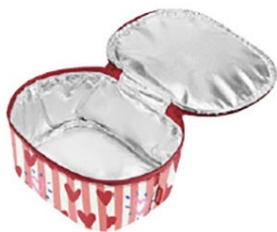
COOLERBAG S POCKET

夢のように美しく。新しい花柄プリント、フローラブルーとフローラローズは牡丹（ポタン）の花からインスピレーションを得ています。絵のようなモチーフは、何千年もの間その完成度を大切にしてきた花そのもののように、力強さと美しさに満ちています。