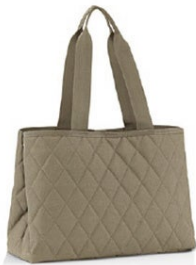
CLASSIC SHOPPER L

都会的で最先端。ロンバスオリーブはスタイリッシュでクラシック。さらに3Dダイヤモンドキルティングのグラフィックラインがこの色のクールさを惹き立てます。飽きのこないデザインです。ロンバスオリーブは、どのバッグを選んでも、スタイリングの頼れるパートナーになってくれることでしょう。