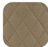
ロンパス オリーブ

心弾むエキサイティングなものになりそうな2024年の新デザイン9種類。ラズベリーアイスクリームのように甘く。花咲く草原のようにロマンティックな装い。サファリのようなワイルドさ。それぞれの季節をより美しく彩るデザインがすべての装いに特別なアクセントを加えます。